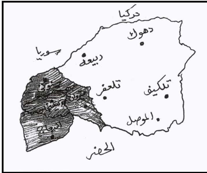
التغيرات الادارية في منطقة الدراسة بعد عمليات التعريب.